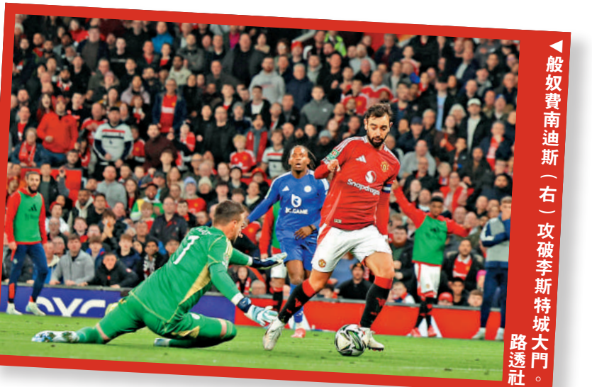
▲般奴費南迪斯（右）攻破李斯特城大門。路透社