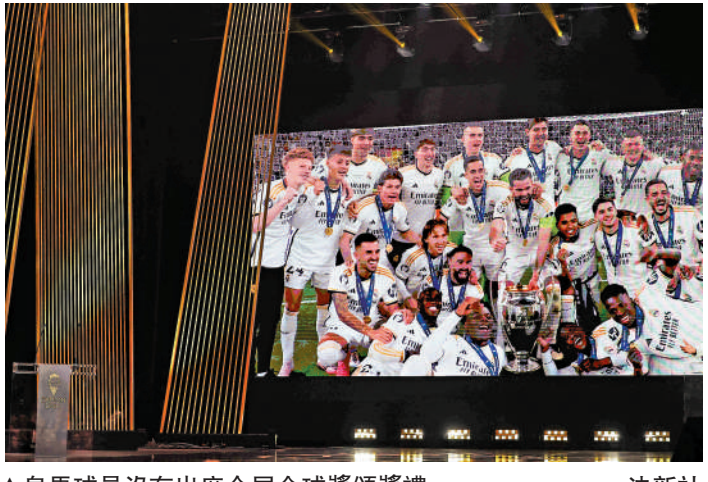
▲皇馬球員沒有出席今屆金球獎頒獎禮。