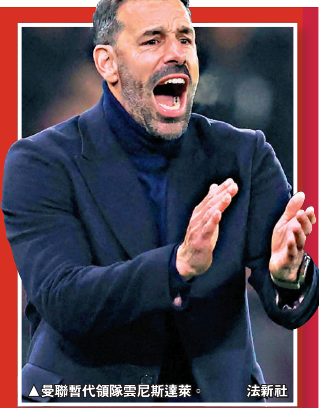
▲曼聯暫代領隊雲尼斯達萊。