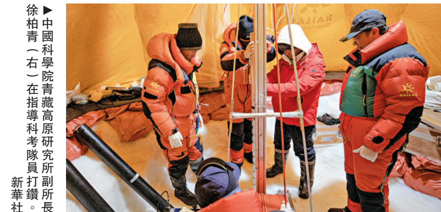
徐柏青（右）在中國科學院青藏高原研究所副所長，在指導科考隊員打鑽所。

極之外研究全球氣候變化的重要「自然檔案」。徐柏青介紹，這裏的最長冰芯有獨特的地理和氣候特徵，記錄了該地區長時間的氣候變化和環境信息，包括溫度、降水等關鍵氣候要素的變化歷史，以及火山噴發、大氣污染等環境事件，為研究全球氣候變化的模式、機制以及預測未來趨勢提供了寶貴的數據和樣本。