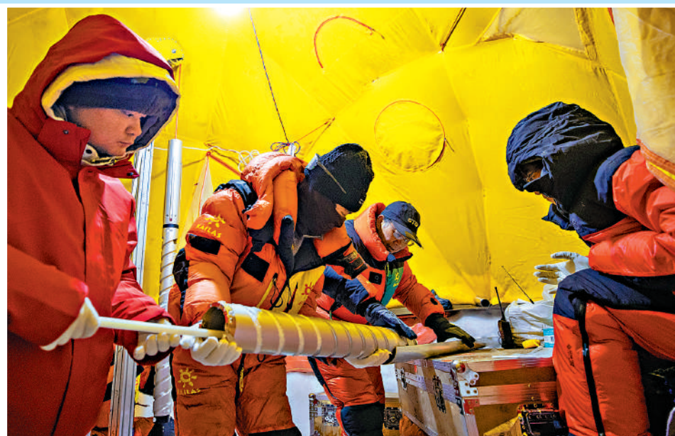
▲在普若崗日冰原海拔6100米處，科考團隊從鑽頭中取出鑽取的冰芯。

據科學家介紹，冰川一旦融化，其封存的地球歷史記錄也將消失，因此鑽取、保存冰芯尤為重要。「通過測厚、取芯，可以更好地審視這個中低緯度地區最大冰原正在發生的變化和所記錄的環境變化，從而更全面地了解全球氣候變暖對冰川的影響。」第二次青島科考隊隊長、中國科學院院士姚檀棟說。