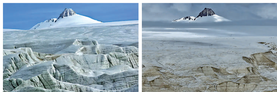
▲左圖為2009年6月拍攝，右圖為2024年9月4日拍攝。對比可見普若崗日主峰下的冰原消融嚴重。