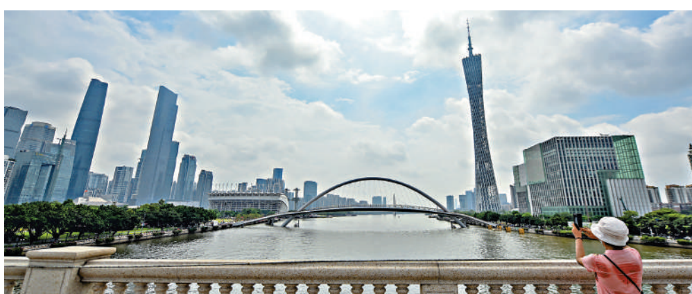
▲廣州取消限購措施後，樓市即時轉旺，交投熾熱。

項目以「城市森林」為主題，園區內設置多功能運動場、休閒綠地和健身設施，讓住戶擁有豐富的生活和休閒體驗。園林佔地約2萬平米，綠化豐富，打造出自然與城市的完美融合。另外，社區配備24小時保安和智能監控系統，全屋配備華為智能系統，以5G、AI技術實現「萬物互聯」，確保業主的安全與便利。