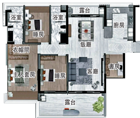
▲新城市領院130平米三房兩廳連書房戶型圖。