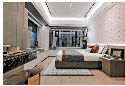
▲廣州城投·天禧睡房設大窗台，增加採光率。