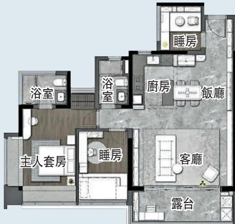
▲廣州城投·天禧108平米三房兩廳戶型圖。