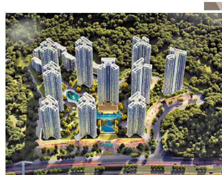
▲能建·天河麓譽府由14幢住宅組成。