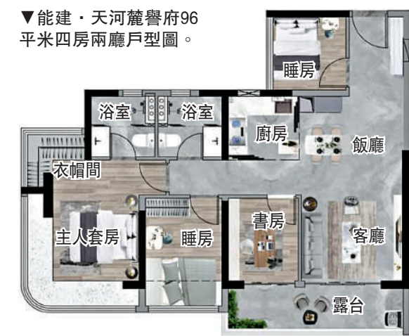
▼能建·天河麓譽府96平米四房兩廳戶型圖。

在戶型方面，項目主推面積80至125平米全南向瞰山戶型，全為四開間朝南，而且主人套房全部實現270度弧形環幕景觀。其中，80平米三房戶型，客廳和睡房全南向。96平米四房戶型，在80平米戶型的基礎上新增一個多功能房。125平米五房戶型，南向採光面達15.5米，陽光攬入室內，客廳和南向睡房直望山景的同時，北向的睡房也帶有轉角窗台，視野同樣開闊。