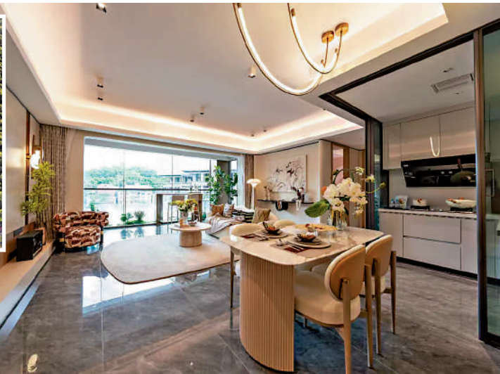
▶能建·天河麓譽府主推全南向瞰山戶型。