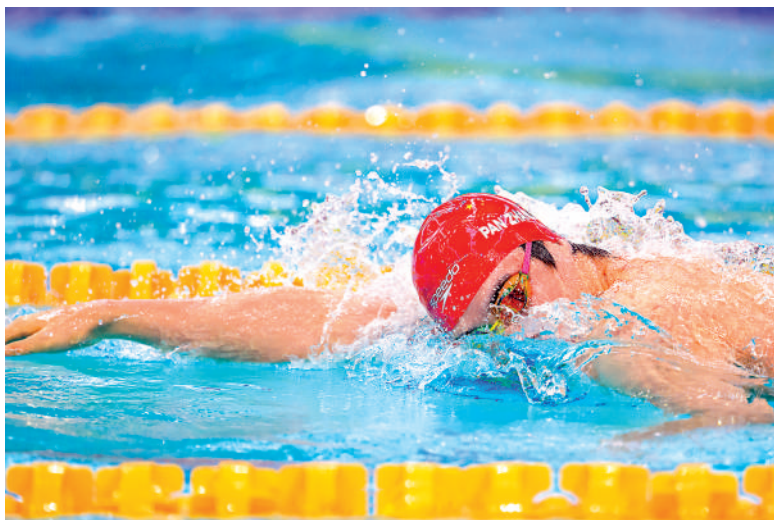
▲潘展樂出戰200米自由泳，以1分41秒59成績取得銅牌。