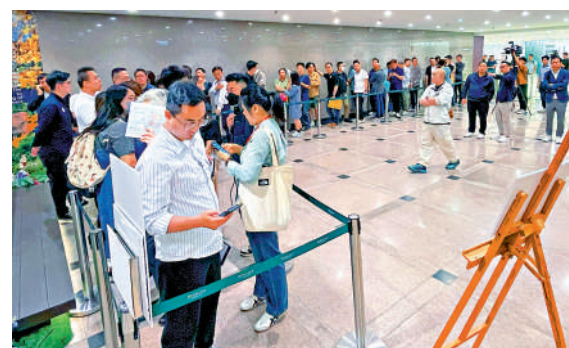
▲DOUBLE COAST I昨日開賣，準買家抵達尖沙咀港威大廈大堂排隊等候上樓樓處。

綜合市場消息，主要新盤昨日錄約44宗成交，計及周五錄得的約66宗，本月首兩日一手共錄約110宗成交。