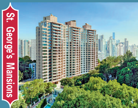
St. George's Mansions