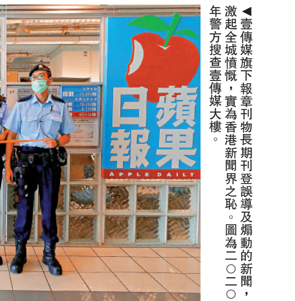
▲壹傳媒旗下報章刊物長期登誤導及煽動的假新聞，激起全城憤慨，香港新聞界之恥。圖為壹（一）二〇二四年警方搜查壹傳媒大樓。