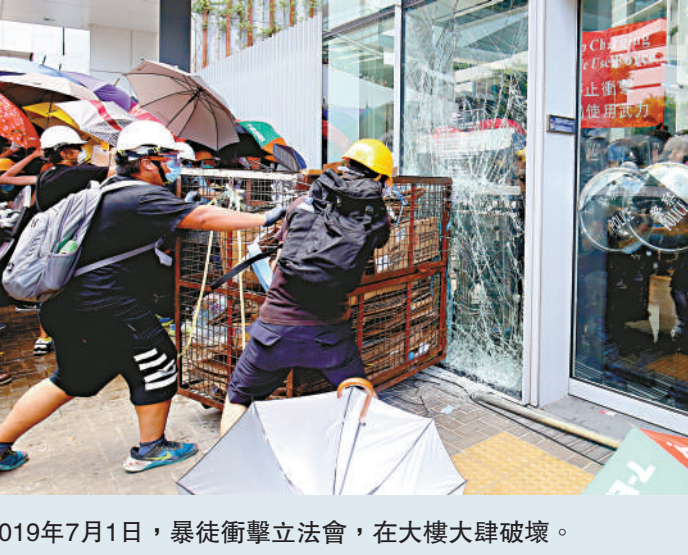
▲2019年7月1日，暴徒衝擊立法會，在大樓大肆破壞。