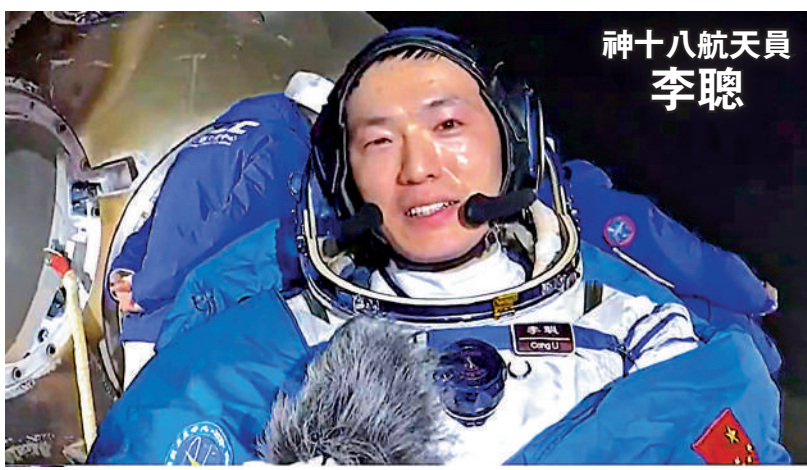
神十八航天员 李聰