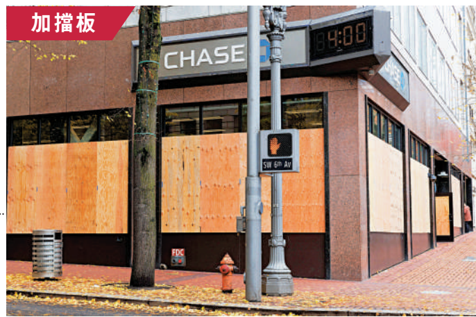
▲波特蘭市一棟建築已安裝擋板。