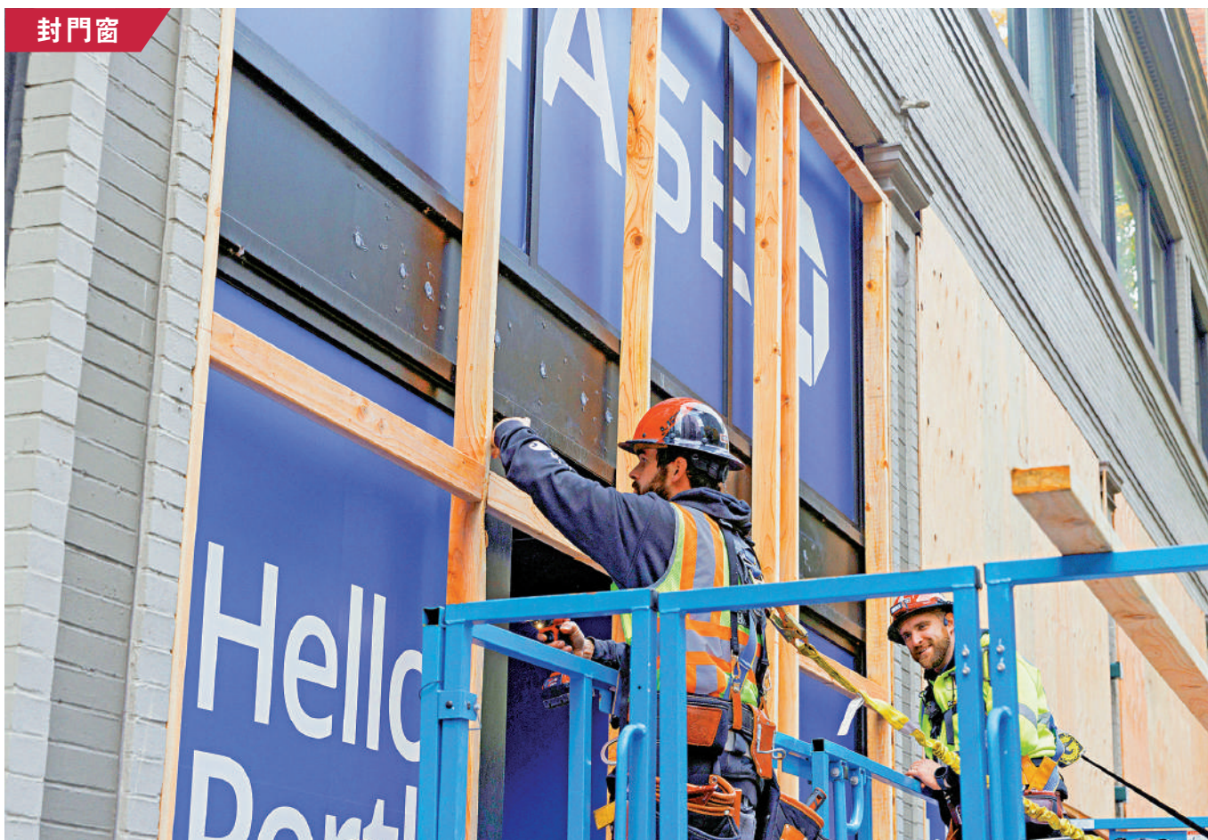
▲俄勒岡州波特蘭市的銀行和辦公大樓1日加固門窗，防範選舉相關暴力事件。