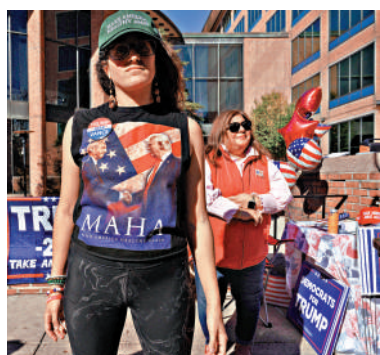
▲特朗普支持者10月31日出現在賓夕法尼亞州票站外。