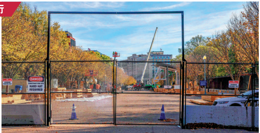
▲白宮附近2日亦設立安全圍欄。