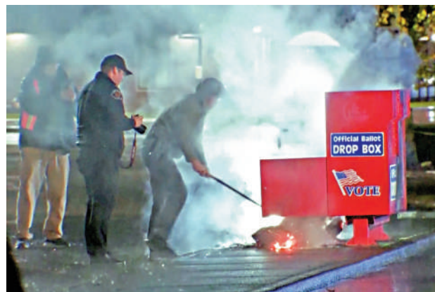
▲華盛頓州一個投票箱10月28日遭縱火。