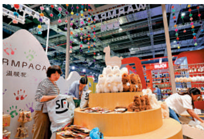
▲工作人員在布置秘魯「溫暖駝」的相關展品。