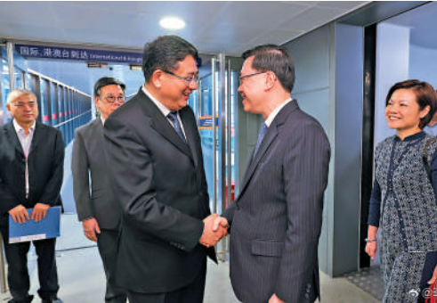
▲香港特區行政長官李家超（右）於11月4日下午抵滬。

李家超將出席5日舉行的第七屆進博會暨虹橋國際經濟論壇開幕式，並到香港展示區的香港企業的展位，參觀和支持港企。他亦會出席由特區政府與香港貿易發展局舉辦的「2024投資香港推介大會——上海專