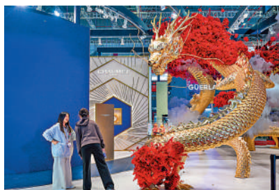
▲第七屆進博會上，法國LVMH展台展出巨型龍雕像。