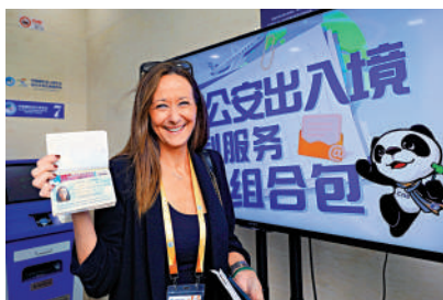
▲上海出入境管理部門為外籍展客商推出系列便民政策。