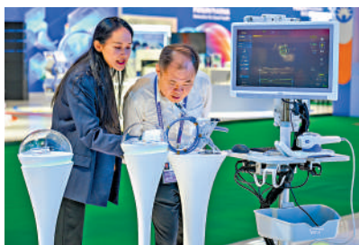
▲參展商介紹進博會首秀的內鏡下袖狀胃成形手術系統。