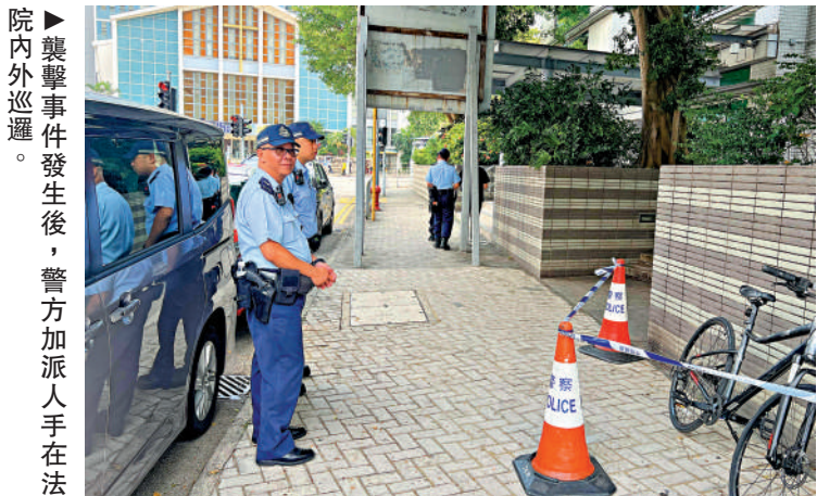
院內外巡邏。 ▲襲擊事件發生後，警方加派人手在法院內外巡邏。

進入高等法院、區域法院、西九龍裁判法院及終審法院，要通過金屬探測器，行李要經X光機掃描。水或飲品等液體均不能帶入法院，只可攜空水樽入內裝飲用水，或在法院大樓內的汽水機購買飲料。