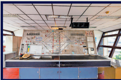
▲車廠北面的塔形建築物頂層是港鐵第一代車廠控制室及控制台（左圖）。