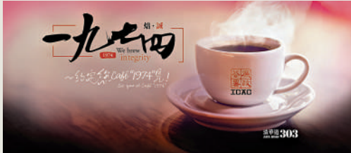
▲廉政公署昨日公布，將於11月15日在北角總部地下開設咖啡廳，取名為「一九七四」。

「一九七四」咖啡廳將於11月14日舉行開幕儀式，並於11月15日公開予公眾使用。