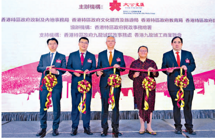
▲國家豐功偉業圖片巡展昨日在九龍城廣場正式啟動。

展覽自9月27日開始至11月間，在18區不間斷巡迴展出。其中九龍城區巡展舉辦日期為11月4日至11月10日。除九龍城民政事務處外，亦得到了香港九龍城工商業聯合會的協助支持。九龍城區各界精英翹楚昨日共同見證了這一盛事。