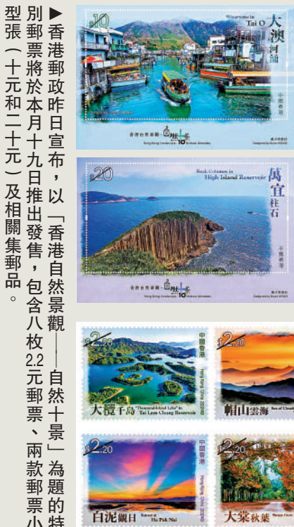
別張（十元和二十元）及相關集郵品。香港郵政昨日宣布，以「香港自然景觀——自然十景」為題的特別郵票將於本月十九日推出發售，包含八枚22元郵票、兩款郵票小型張（十元和二十元）及相關集郵品。

各郵政局將於11月19日為所有正式首日封／紀念封／註明首日字樣和本地地址的自製封，提供即時人手蓋印服務。