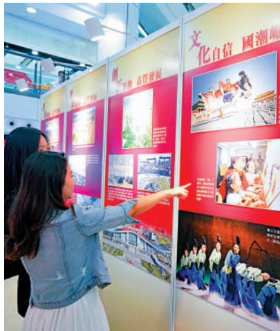
▲不少市民在觀賞展覽，了解國家輝煌成就。

【大公報訊】「豐功偉業——中華人民共和國成立75周年輝煌成就圖片精粹巡迴展覽」（九龍城區）巡展昨日在九龍城廣場正式啟動。展覽內容豐富，以圖文形式深刻展現國家在經濟騰飛、科技創新、文化繁榮、軍事強盛及基礎設施建設等方面的非凡成就。