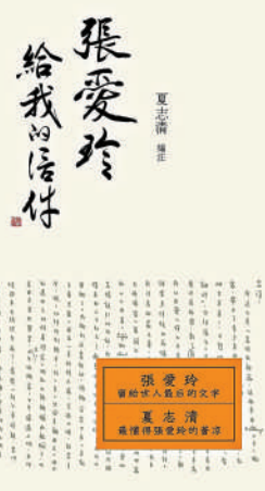
▲夏志清編註《張愛玲給我的信件》。