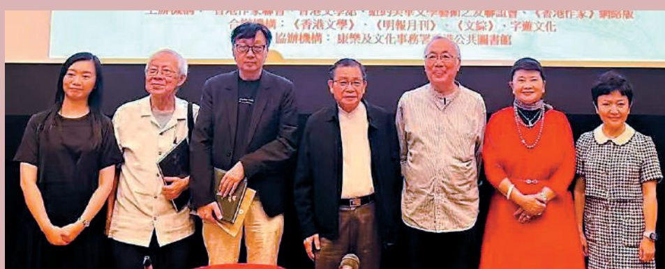
▼「夏志清、宋淇與張愛玲研究」文學講座嘉賓合照。