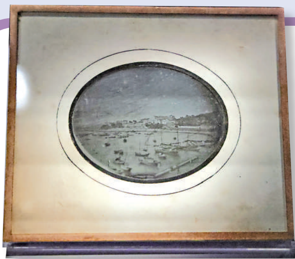
▲《澳門南灣》是現存最早期的中國影像照片之一。