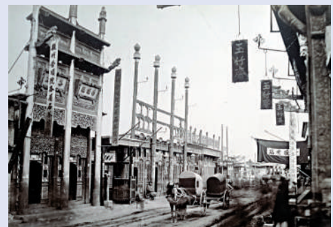
▲華芳照相館拍攝《北京的驛馬市大街》。

是次展出的展品既有展現第二次鴉片戰爭、洋務運動、甲午戰爭、八國聯軍入侵及日俄戰爭等重要歷史事件老照片；也有當時城市景觀、歷史建築、百姓生活等。張頌仁表示，通過觀看老照片，感受時光的倒流，這種直觀上的感受，更能讓觀眾具有親身的體驗，從而更好地回望當時的人和事，形成對一個時代的「造像」。