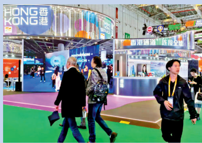
▲愈來愈多香港企業參加進博會，希望拓展內地市場。