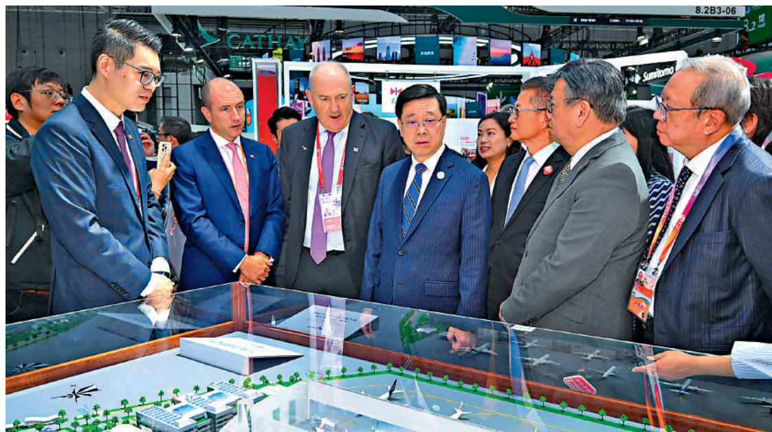
行政長官李家超昨日在上海參觀第七屆中國國際進口博覽會，與香港企業參展商交流。