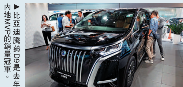
內地MVP的銷量冠軍。比亞迪騰勢D9是去年