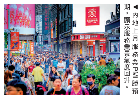
◀內地上月服務業PMI勝預期,顯示服務業景氣度回升。

升。10月服務業經營預期指數在擴張區間升至6月以來新高。財新智庫高級經濟學家王喆表示,從財新中國製造業和服務業PMI各項數據看,市場需求止跌回穩,樂觀情緒有所恢復,政策效果開始顯現。不過,當前就業市場壓力依然較大,價格水平仍較為低迷,增量政策在擴內需、促就業等方面效果如何,值得關注。