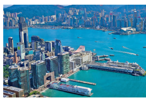
▲港PMI上月升至52.2,創1年半以來最高。