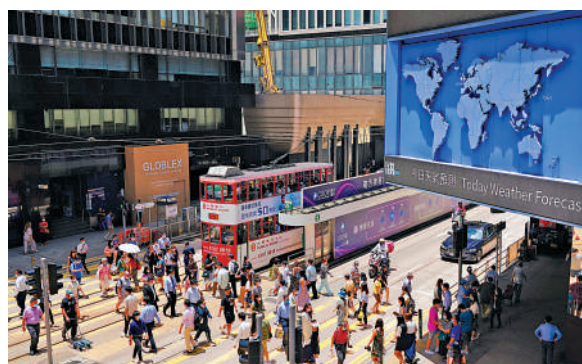
▲香港開發更多元化的投資產品，有助鞏固國際金融中心地位。