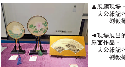
▲現場展出的扇面作品。

【大公報訊】記者劉毅報道：女子描繪的山水、花鳥畫，會呈現怎樣的特點？香港女中國書畫家協會正在香港大會堂低座一樓展覽廳舉行第四屆會員作品展，展出160餘件書畫作品，涵蓋山水、花鳥、書法和篆刻等，工筆、寫意等筆法兼有，呈現給觀眾一派春意盎然之感。展期至11月10日。