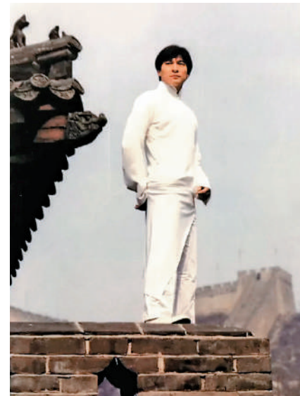
▲劉德華登上長城拍攝《中國人》MV。