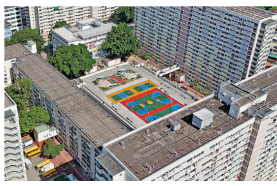
▲逾六十年歷史的彩虹邨計劃分期三期清拆重建。