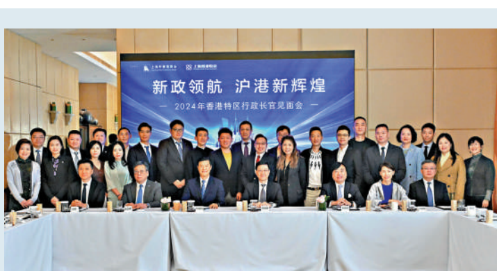
▲行政長官李家超昨日在上海與新赴港企業和人才代表見面並合照。