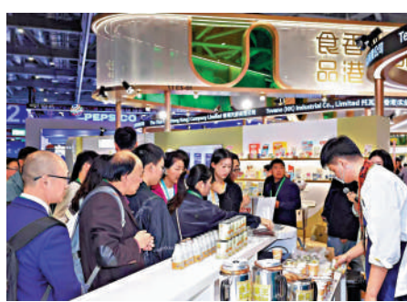
▲金茶王在進博會香港展館現場展示港式奶茶。

今年進博會共有331家香港企業參展，佔進博會參展商總數的近十分之一，創下新高，在所有參展的國家和地區中，參展企業數位居第一。在香港產品展館，香港益創膳研製的科研成