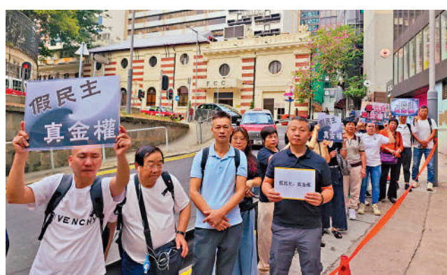
▲多位香港市民昨日（6日）上午自發到香港外國記者會外抗議，譴責美國「假民主、真霸凌」，粗暴干涉香港事務。

【大公報訊】記者龔學鳴報道：多批香港市民昨日到香港外國記者會（FCC）外，抗議美國嚴重雙標。現場抗議市民表示，之前美國出的一系列涉港「法案」完全是對中國內政的粗暴干涉，給香港帶來的是社會動盪、經濟受損和民眾生活被擾亂。「一國兩制」方針保障香港市民的根本利益，促進香港的長治久安和繁榮發展，市民應認清美國「自由選舉」外衣下的醜惡嘴臉。