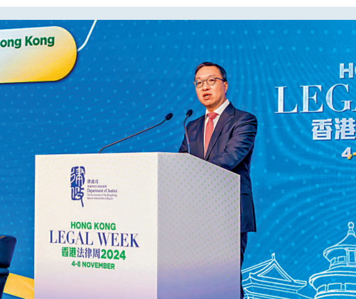
▲林定國昨日出席在會展中心舉行的「超越訴訟：香港替代爭議解決的多元化生態」法律周活動。