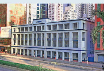
▲舊灣仔警署將改建成國際調解院總部。

舊灣仔警署將改建為國際調解院總部，預計明年中前完成翻新工程，成為首個在香港設立總部的「政府間國際組織」，專門以調解方式處理國際爭議，將會大大提升香港成為全球「調解之都」的國際形象，吸引爭議各方、調解員、律師及其他專業人士來港進行調解。