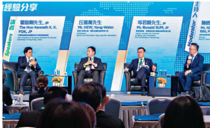
▲法律周第三日活動，霍啟剛（左一）等嘉賓出席，討論解決體育糾紛的經驗。

政策宣言闡明政府就進一步推廣使用調解以友好方式解決爭議的政策立場和方向，落實2023年施政報告中有關深化調解文化的政策，並鞏固香港在國家政策下作為亞太區國際法律及爭議解決服務中心的策略性定位。同時鼓勵各界更廣泛使用調解作為靈活和有建設性的庭外解決爭議方法，締造雙方接納的解決方案，並控制風險、費用和需投放的時間，有助建立和諧穩定的社會，以及培育互相支持、尊重、和睦和包容的文化。