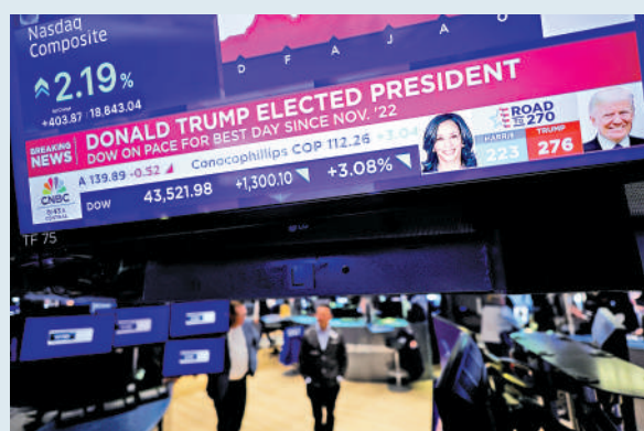
▲美股昨晚高開後升勢急劇擴大，曾飆逾千四點。

同時，分析師又認為，特朗普限制移民、減稅、大增關稅若落實，便會加劇通脹和債息上升壓力。昨日美10年期債息曾大升19點子，至4.46厘。