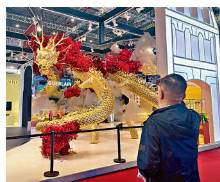
▲路威酩軒集團打造的「龍」主題展館，傳遞東方文化融合的時尚盛宴。