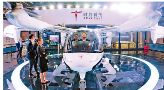
▲參觀者在本屆進博會汽車展區體驗電動垂直起降飛行器。新華社 大公報記者孔雯瓊

進博會上，低空經濟企業收穫了熱烈的市場反饋，如沃爾特航空與南航通航、金鹿公務、中國通航、中國飛龍新簽VE25-100意向訂單超165架，訂單金額逾35億元人民幣。此外，御風未來「空中出租車」M1 eVTOL在進博會第二天亦收穫了規模訂單，11月6日，金融租賃公司浦銀金租與御風未來達成戰略合作，雙方就100架M1純電動飛機型載人版達成採購意向，意向合作規模超10億元人民幣。