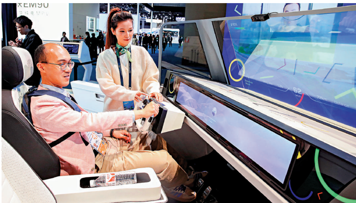
▲11月7日，觀眾在第七屆進博會汽車展區體驗大眾展台內的一款模擬駕駛艙。新華社