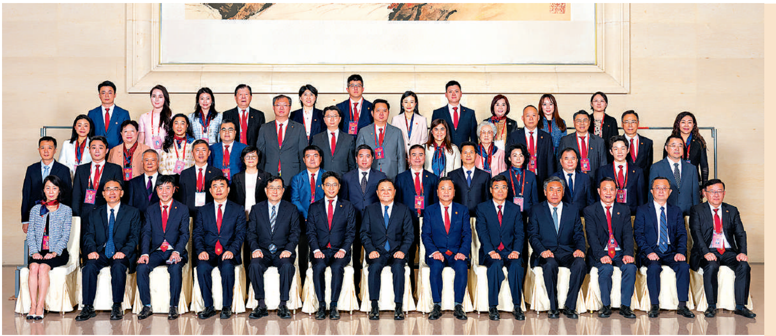
▲11月6日，港區省級政協委員聯誼會組織了由主席蘇清棟、會長霍啟山率領的52人訪問團前往廣東考察交流。廣東省委副書記、省長王偉中（前排正中）在廣州會見了訪問團成員。

據了解，港區省級政協委員聯誼會成立於2006年9月，是在全國政協、中央統戰部、國務院港澳辦和中央政府駐港聯絡辦的支持下設立的愛國愛港社團，現有3600多名來自全國30個省、自治區、直轄市及15個副省級城市的港區政協委員。