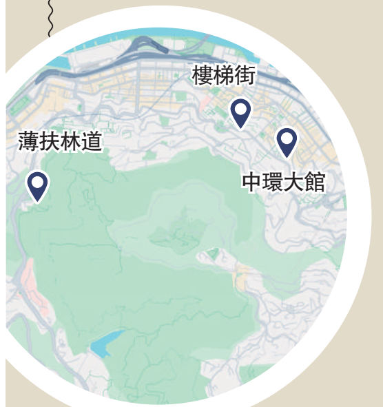
薄扶林道 中環大館 樓梯街