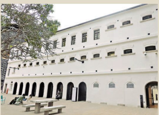
▲戴望舒曾被關押的域多利監獄，現活化為大館的一部分。