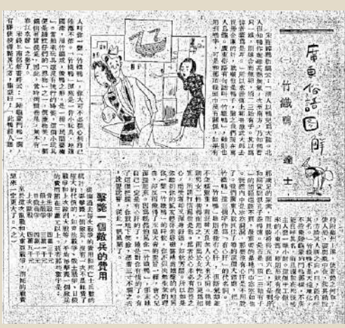
▲戴望舒所撰《廣東俗語圖解》。

1941年，戰火蔓延到了香港，日軍佔領香港及南洋諸島。1942年，日本以戴望舒「從事抗日活動」而將其抓捕，投進中環域多利監獄，詩人遭受種種酷刑也不屈服，不僅沒有被消滅意志，反而寫下了詩作《獄中題壁》和《我用殘損的手掌》。曾繁裕稱：「這段經歷令戴望舒的創作風格，從先前的浪漫詩意轉向書寫現實，面對敵人，他用殘損的手掌，堅持發聲，寫下內心悲憤，通過創作表