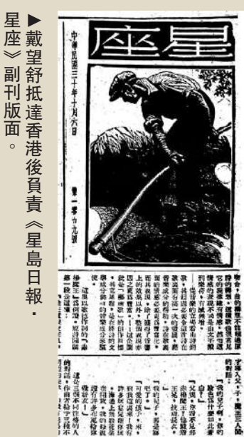
▲戴望舒抵達香港後負責《星島日報·星座》副刊版面。

窗外，隔着夜的帳幔，迷茫的山嵐大概已把整個峰巒籠罩住了吧。冷冷的風從山上吹下來，帶着潮濕，帶着太陽的氣味，或是帶着幾點從山澗中飛濺出來的水，來叩我的玻璃窗了。