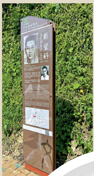
►薄扶林中西區文學徑上的戴望舒傳意牌。