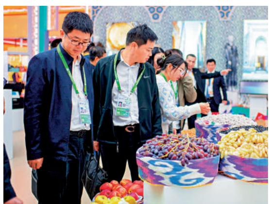
▲在第七屆進博會烏茲別克斯坦國家館，當地特色瓜果蔬菜吸引參觀者目光。