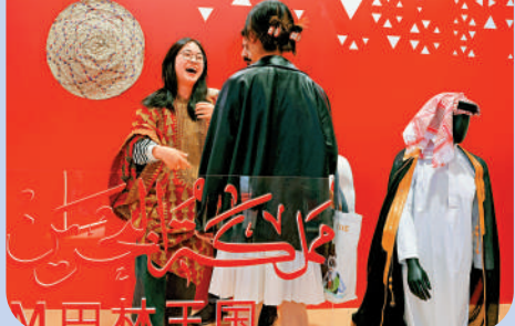
▲觀眾在第七屆進博會國家展巴林館試穿巴林服裝。