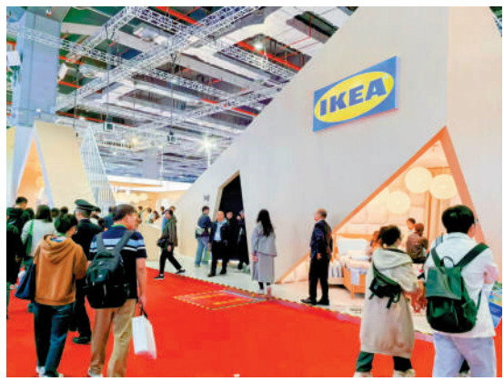
▲在第七屆進博會上，宜家展臺吸引眾多觀眾參觀。