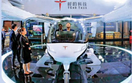
▲觀眾在第七屆進博會汽車展區體驗時的科技E20國產eVTOL電動垂直起降飛行器。