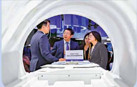
▲觀眾在第七屆進博會醫療器械及醫藥保健展區GE醫療展臺了解一款讀秒成像磁共振儀器。新華社