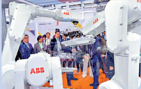
▲在第七屆進博會技術裝備展區瑞典機器巨擘ABB展臺拍攝的控制櫃高性能挑戰演示。