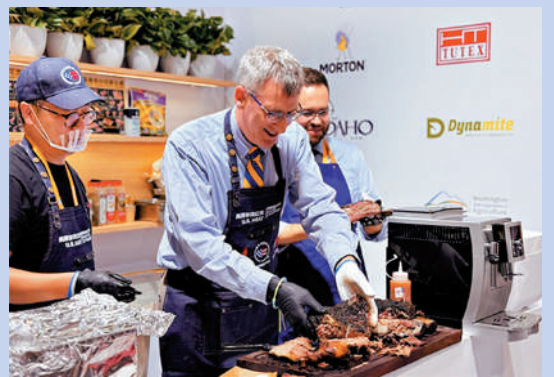
▲美國農業部代理副部長幫辦傑森·哈菲邁斯特在進博會美國食品與農業館展臺上。