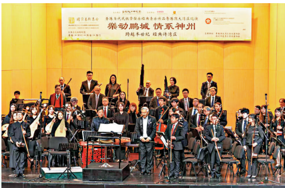
▲香港城市中樂團在深圳舉行的「樂動鵬城 情繫神州」音樂會。

記得小時候讀過關於辛棄疾的故事書，立即深深地被這個人物所打動。因此這次巡演的全部五場