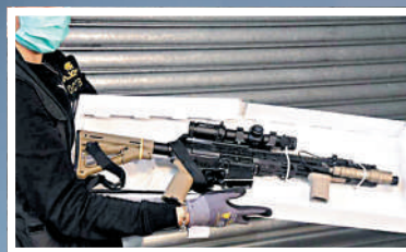
▲警方當日在拘捕「屠龍小隊」成員行動中檢獲大殺傷力武器。

就「屠龍案」的裁決，警方國家安全處總警司李桂華早前表示不會評論，但指有關案件是非常嚴重的案件，「有真槍，甚至有長槍、有炸藥，炸藥的分量可以造成很大的死傷。惟有一件事可以代表警方說，我們是非常重視這類案件，我們會繼續保障我們香港人、在香港生活的人的人身安全，以及他們的財產安全。」