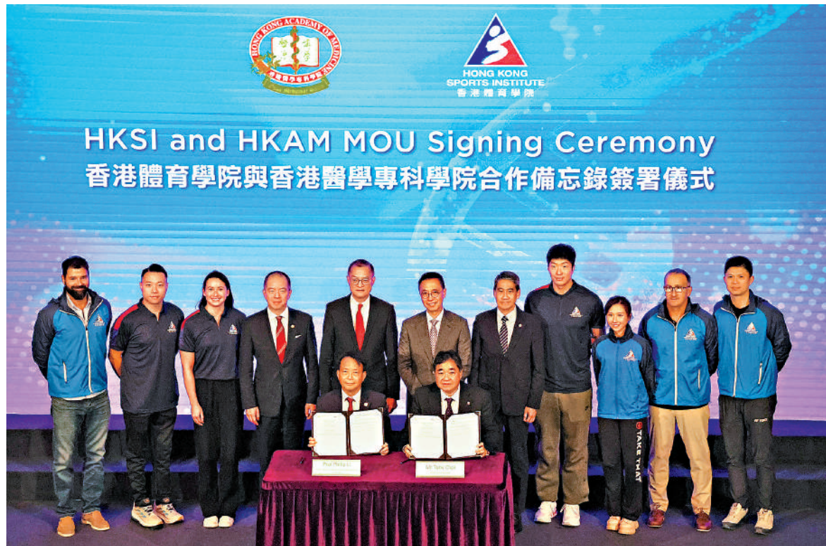
▲體院與醫專昨日在香港體育學院進行合作備忘錄簽署儀式。