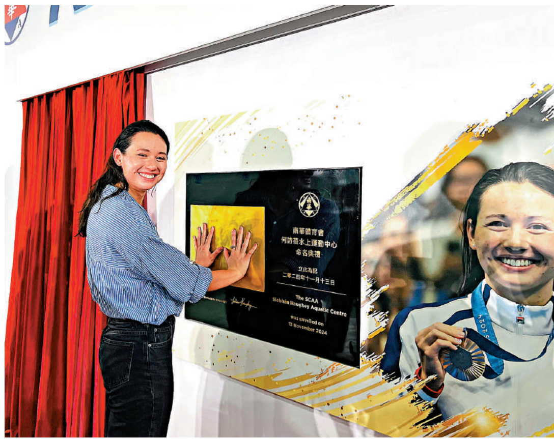
「南華體育會何詩蓓水上運動中心」昨日正式開幕。