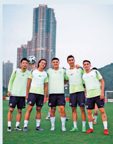
▲港足球員操練後合影。

香港足總昨晚在社交平台發帖文，宣布賽事若在開賽前5小時（下午3時），8號風球仍然生效，比賽將延期至周五晚上8時；惟若天文台預早公布會在比賽前取消8號風球，足總將視乎情況考慮讓比賽如常舉行。如比賽因任何情況（例如颱風）順延至48小時內舉行，足總將不作退款。