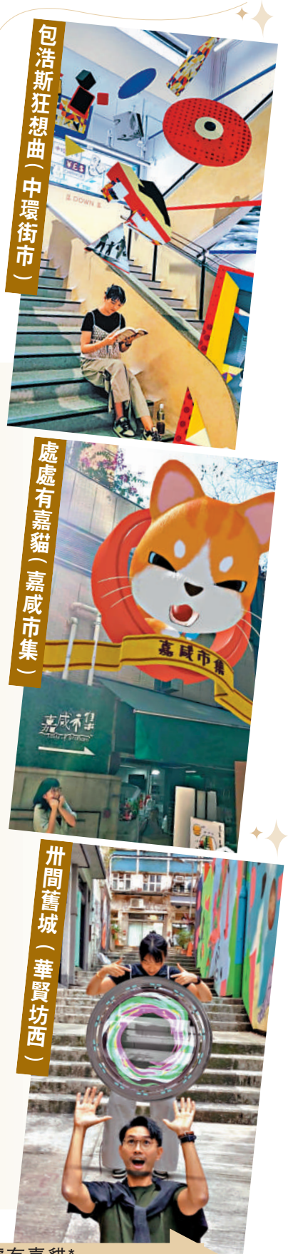
包浩斯狂想曲(中環街市)