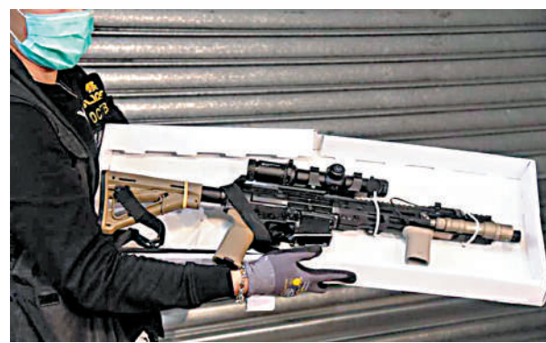
警方在拘捕「屠龍小隊」成員行動中檢獲大殺傷力武器。