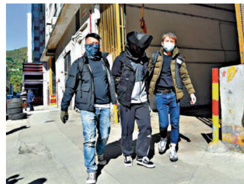
▲警方在2019年「民陣」遊行前後拘捕多名「屠龍小隊」成員。