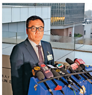
隊一案的判例非常嚴重。

李桂華說，警方會繼續仔細研究判詞及判刑理由，考慮是否就個別罪行的判刑提出覆核，強調會竭盡所能，繼續阻止及調查這類極端、暴力、恐怖的組織在香港運作，並呼籲市民提高警覺，如發現任何可疑要立即報警。