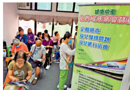
▲《健康快車免費眼底病變篩查》今日起在十八區陸續展開，鼓勵市民防患於未然。

照片，並運用人工智能分析眼底圖像，10分鐘內便可生成初步的眼底檢查報告，幫助提早識別眼底病變。健康快車今日起至年底先走訪黃大仙、沙田及深水埗等10區，15歲或以上市民可透過支持機構登記參加。