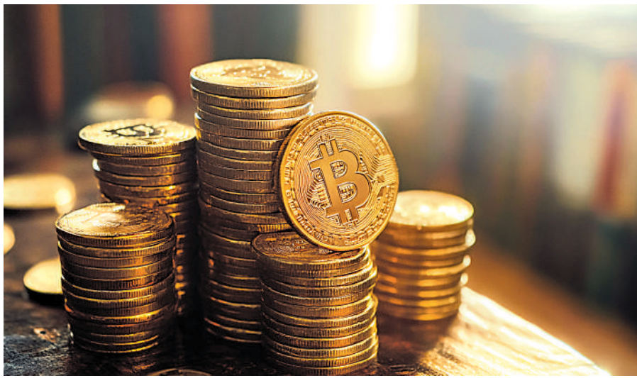
◀比特幣作為資產儲備的最大缺陷，正是幣值極不穩定。