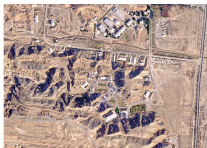
▲德黑蘭郊外的伊朗帕爾欽軍事基地。

聯合國駐黎巴嫩臨時部隊（聯黎部隊）15日發表聲明稱，一枚炮彈當天擊中黎南部聯黎部隊意大利營地，所幸未爆炸。意大利外長塔亞尼就此事向以色列外長薩爾提出抗議。