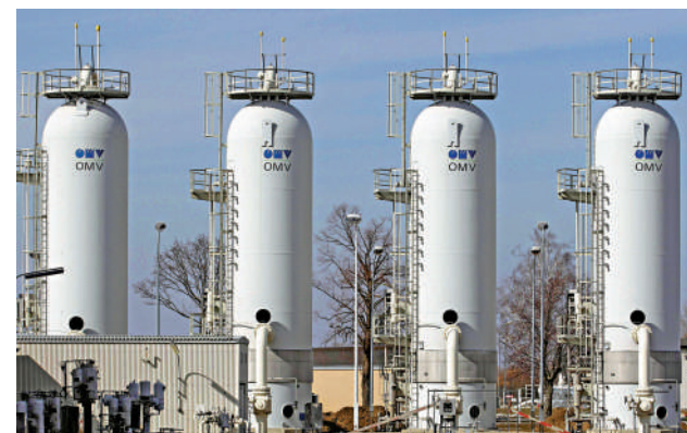
▲奧地利境內的輸氣管道。

最新統計顯示，俄羅斯在2023年經烏克蘭輸出約150億立方米天然氣，約佔2018-2019年俄羅斯輸往歐洲天然氣流量峰值的8%。