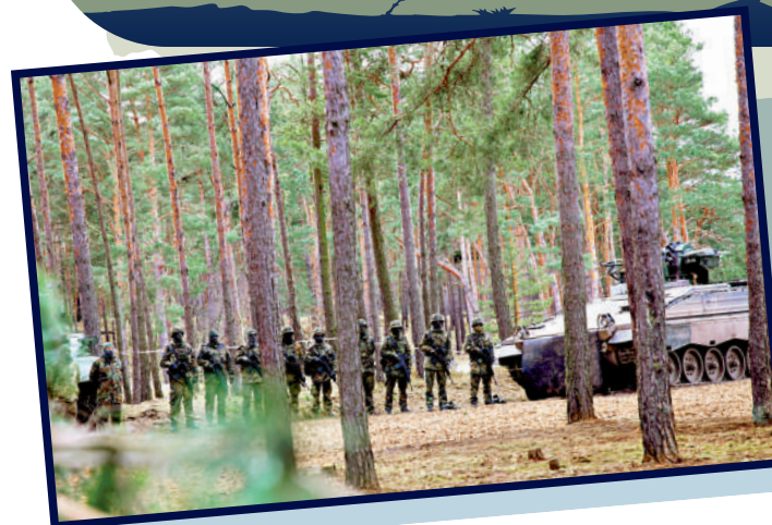
▲烏軍士兵在德國基地受訓。