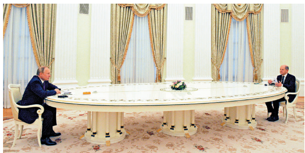
▲2022年2月15日，俄羅斯總統普京（左）在莫斯科與德國總理朔爾茨會面。