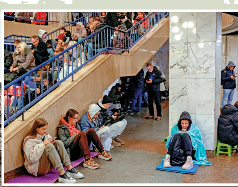
▲俄軍發動空襲，基輔民眾躲進地鐵站避難。