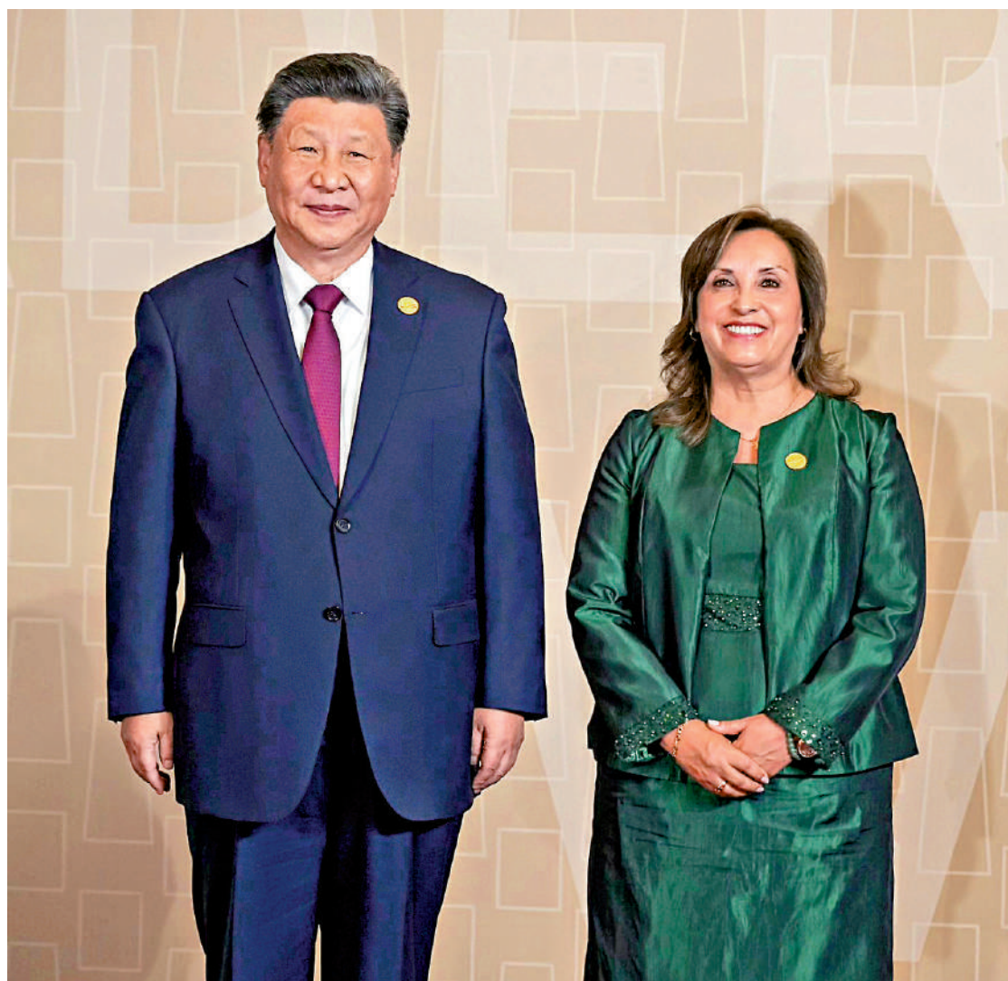
▲當地時間11月16日，國家主席習近平在秘魯利馬會議中心出席亞太經合組織（APEC）第三十一次領導人非正式會議並發表重要講話。圖為習近平抵達會場時，秘魯總統博魯阿爾特親自迎接。APEC Peru 2024 Facebook

用好亞太經合組織平台，加強經濟技術合作，加大對發展中經濟體和弱勢群體的支持，共同做大並分好經濟發展「蛋糕」，讓更多經濟體、更多民眾共享發展成果。中方將在亞太經合組織推進提高居民收入、促進中小企業集群式發展等倡議，助力亞太經濟普惠包容發展。