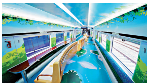
▲列車以三亞熱帶海島特色景觀為主題，精心打造了主題車廂。

據介紹，三樂旅遊鐵路列車最高運營時速200公里，4節編組最大載客量均超660人，擁有科技智能、綠色節能、運維經濟等優勢，列車人均百公里能降低15%。全車搭載30多項智能化配置，構建Smart care車地一體化智能運維平台，實現車輛狀態實時監測、故障智能診斷、維修智能決策，列車全壽命周期檢修維護成本降低超30%。項目串聯三亞市中心城區、鳳凰國際機場、崖州區、天涯海角、南山等核心功能區與客流集散樞紐，有力助推沿線旅遊開發，對推動三亞經濟圈一體化發展、服務海南自貿港建設具有重要意義。