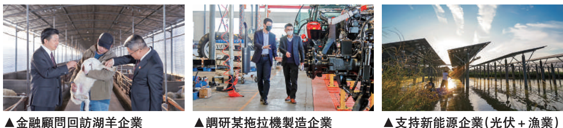
▲金融顧問訪湖羊企業 ▲調研某拖拉機製造企業 ▲支持新能源企業（光伏+漁業）

浙商銀行是十二家全國性股份制商業銀行之一，於2004年8月18日正式開業，總部設在浙江杭州，是全國第13家「A+H」上市銀行。開業以來，浙商銀行立足浙江，放眼全球，穩健發展，已成為一家基礎扎實、效益優良、風控完善的優質商業銀行。2024年上半年，浙商銀行總資產3.25萬億元人民幣（下同），營業收入352.79億元，歸屬於本行股東的淨利潤79.99億元；在全國22個省（自治區、直轄市）及香港特別行政區，設立了350家分支機構，實現了對浙江大本營、長三角、粵港澳大灣區、環渤海、海西地區和部分中西部地區的有效覆蓋。在英國《銀行家》（The Banker）雜誌「全球銀行1000強」榜單中，本行按一級資本計位列84位。中誠信國際給予浙商銀行金融機構評級中最高等級AAA主體信用評級。