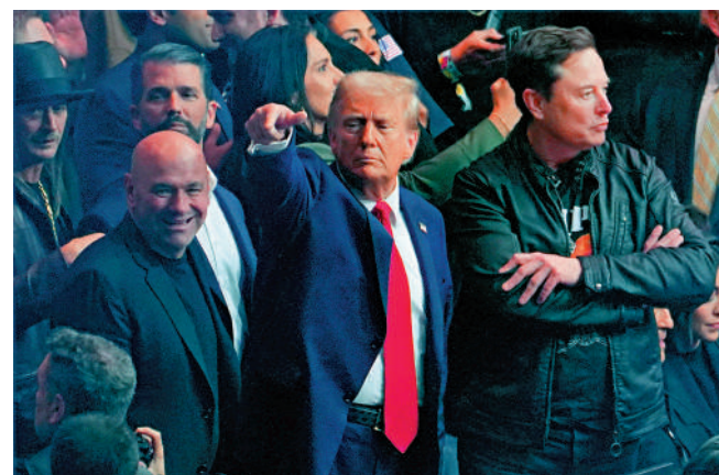
▲馬斯克（右一）16日與特朗普（右二）在紐約觀看格鬥比賽。

16日，馬斯克發文稱：「我覺得盧特尼克比貝森特更適合擔任財政部長。」他稱，選擇貝森特將過於循規蹈矩，無法為美國帶來實際的改變，並鼓勵其近2億粉絲一起參與討論。美媒認為，馬斯克此舉表明他並不是很尊重特朗普的人事任命。特朗普的盟友也對其行為表示驚訝。通常，已獲提名者不會在其他職位人選尚未出爐時公開評價該職位的潛在候選人。