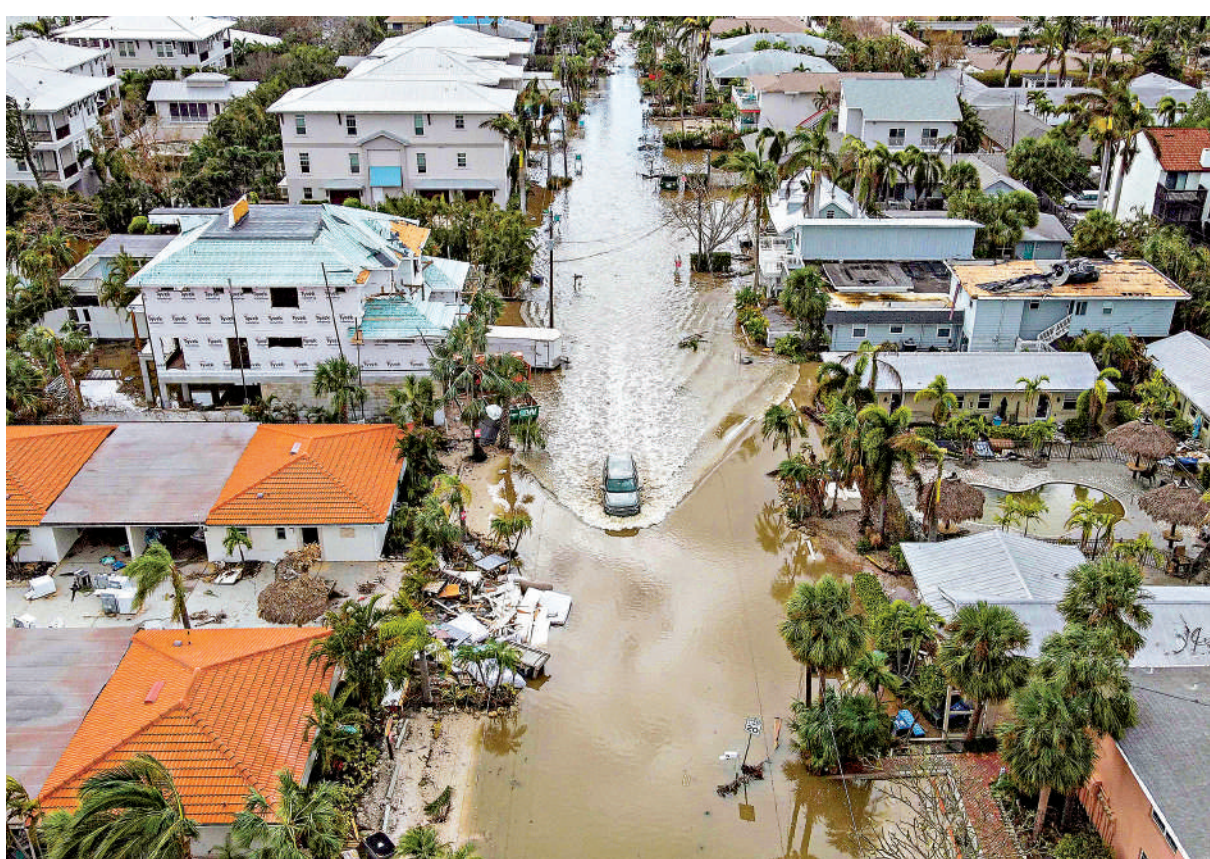
▲美國極端天氣頻發，今年大選前接連遭遇兩場颶風，在佛州等地造成嚴重破壞。