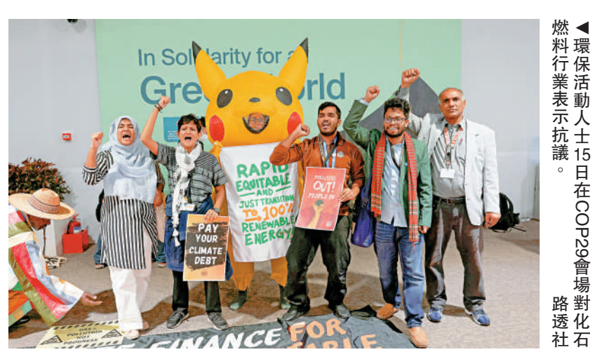
▲環保活動人士15日在COP29會場對化石燃料行業表示抗議。

聯合國秘書長古特雷斯說，到2030年，適應氣候變化所需的資金可能出現每年3590億美元的缺口。國際社會迫切期待發達國家兌現資金承諾、幫助發展中國家共同應對氣候變化挑戰。法新社報道稱。經過近一周的討價還價，各國仍未能就一項針對發展中國家氣候行動投資的1萬億美元方案達成協議。一名法國外交官表示，各方希望能在巴庫達成協議，但現在的狀況遠未達成協議的程度。