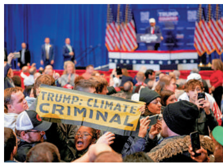
▲示威者1月出現在特朗普集會現場，抗議其氣候政策。

特朗普上周提名紐約州前共和黨眾議員澤爾丁擔任環境保護署署長。他聲稱，將恢復美國的能源主導地位，振興汽車產業。（綜合報道）