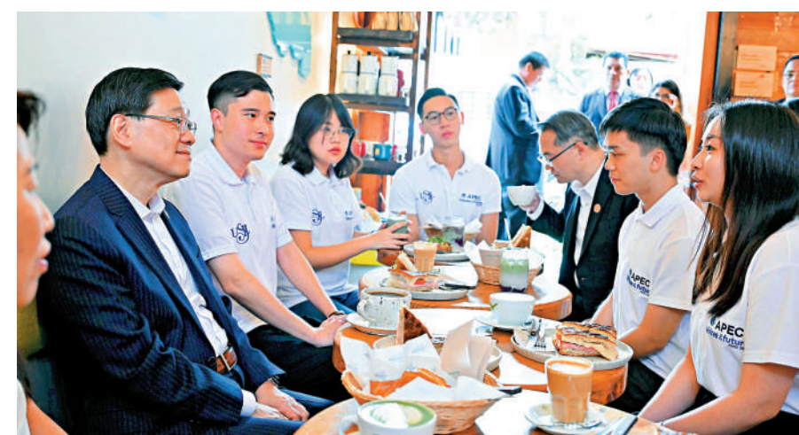
▲16日（利馬時間），李家超與多位參與2024年亞太經合組織未來之聲計劃的中國香港代表會面，聽取他們參與有關計劃的經驗和收穫。

「天行健，君子以自強不息。」在百年未有之大變局下，面對風雲變幻，香港必須主動識變、應變、求變。特區政府不遺餘力開拓新市場，為工商界進軍當地搭橋鋪路，香港工商界也應發揮好主力軍作用，與特區政府一道，不斷拓寬國際化發展通道，奮力向前，用實際行動共同譜寫香港發展新篇章。