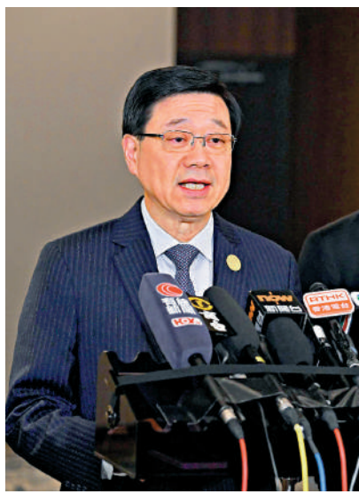
▲行政長官李家超昨日在秘魯利馬會見傳媒，總結出席亞太區經濟合作組織（APEC）會議的行程。