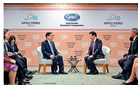
▲李家超15日（利馬時間）與新加坡總理兼財政部長黃循財會面。

秘魯距離香港2.9萬公里，航程約30小時，李家超不遠萬里前往當地，皆因APEC成員經濟體是香港重要的貿易夥伴，佔本港外貿總值約八成，而秘魯也是參與「一帶一路」的國家之一。這是他上任後首次出訪南美洲，特區政府高度重視今次訪問，希望與APEC成員經濟體深化合作，支持區域經貿合作，開拓發展機遇，互利共贏。而APEC有多個成員經濟體本身也是「區域全面經濟夥伴關係協定」（RCEP）的成員，李家超亦趁這次機會繼續向各成員爭取支持，希望讓香港盡早加入RCEP。