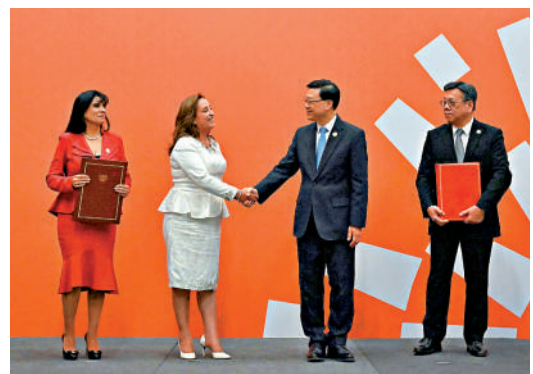
▲15日（利馬時間），李家超出席香港與秘魯《自由貿易協定》簽署儀式。

清關程序及貿易便利化、服務貿易、金融服務及電子商貿等，內容超越香港與秘魯各自在世界貿易組織下所作承諾。在自貿協定下，香港的服務提供者在超過150個服務行業可受惠；在貨物貿易方面，秘魯承諾佔其約98.3%關稅稅目的香港原產貨物，可享受關稅待遇進入秘魯市場，出口往秘魯的香港原產貨物將更具競爭力。香港業界可受惠於撤銷或削減關稅，以及減少貿易壁壘，而服務提供者和投資者於秘魯營運時，亦於法律保障下受惠更佳市場准入和國民待遇。