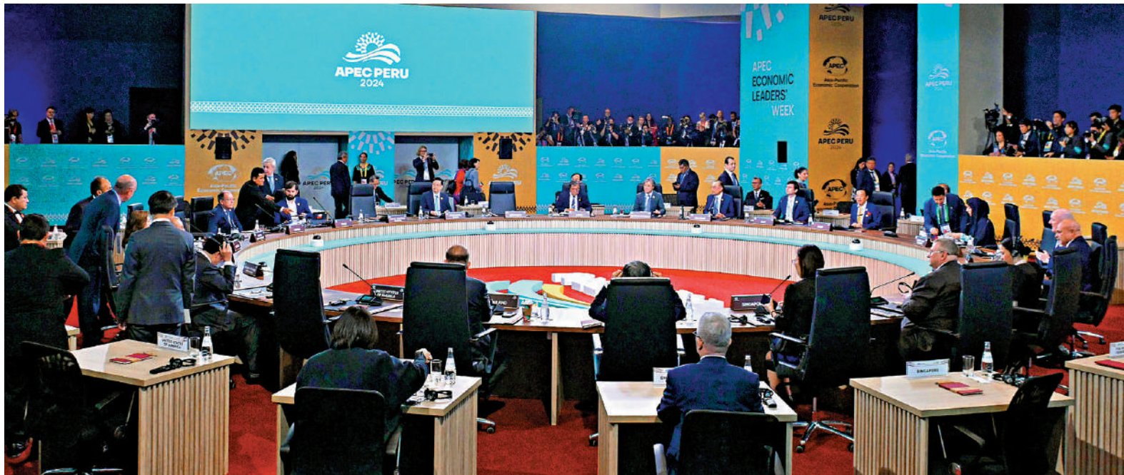
▲李家超15日（利馬時間）出席亞太區經濟合作組織領導人與東道主嘉賓非正式對話。