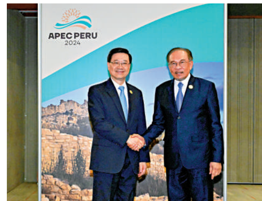
▲李家超15日（利馬時間）與馬來西亞總理安華會面。