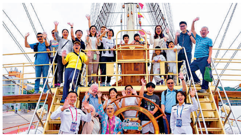
市民登艦參觀，心情興奮。

朝霞晨霧中，標誌性的桅杆聳立海上，昨日早上七時許，「破浪艦」由本港東面藍塘海峽駛入維港，在解放軍駐港軍艦宿遷艦領航下，駛至駐港部隊昂洲軍營停靠。