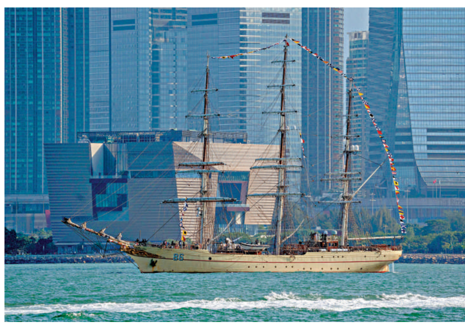
「破浪艦」駛抵香港，背後可見西九的故宮館。