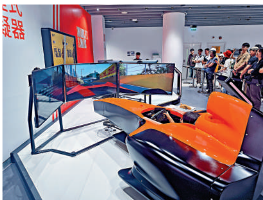
賽車博物館設有互動體驗區。大公報記者吳俊宏攝

博物館這輛賽車是第一款中國品牌TCR型的領克，馬青驊表示，中國製造的水平已經是世界比較靠前的位置，在任何的競技區域成績是最好的。