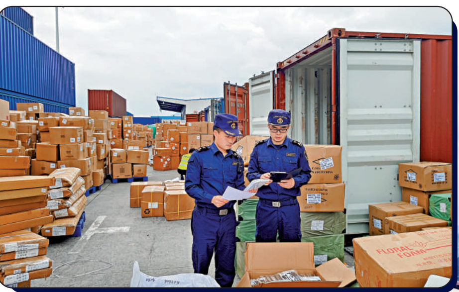
重慶海關關員對經中歐班列出口的機械設備和日用百貨進行查驗。

10月25日，伴隨着清脆的汽笛聲，一列早些時候從越南河內發車，裝載汽車電子零配件等貨物的「東盟快班」駛出重慶團結村中心站，2周後列車抵達波蘭馬拉舍維奇，比以往亞歐跨境運輸縮短5至10天。這列首趟「東盟快班」的開行，標誌着西部陸海新通道與中歐班列（渝新歐）兩大貿易通道在重慶實現「無縫銜接」，為解決多式聯運「最後一公里」提供了新思路與操作樣板；也為中國深化與東盟、歐洲地區的產業鏈供應鏈合作創造了新場景，開啟了亞歐貿易往來的便捷新通道。 大公報記者 韓毅