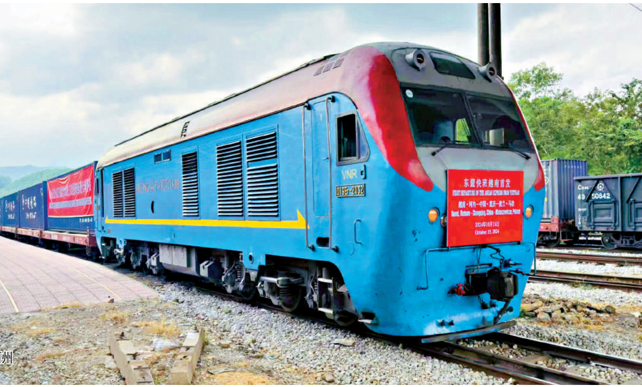
▲首趟「東盟快班」於10月15日從越南河內發車，抵達重慶重新編組後發往歐洲。