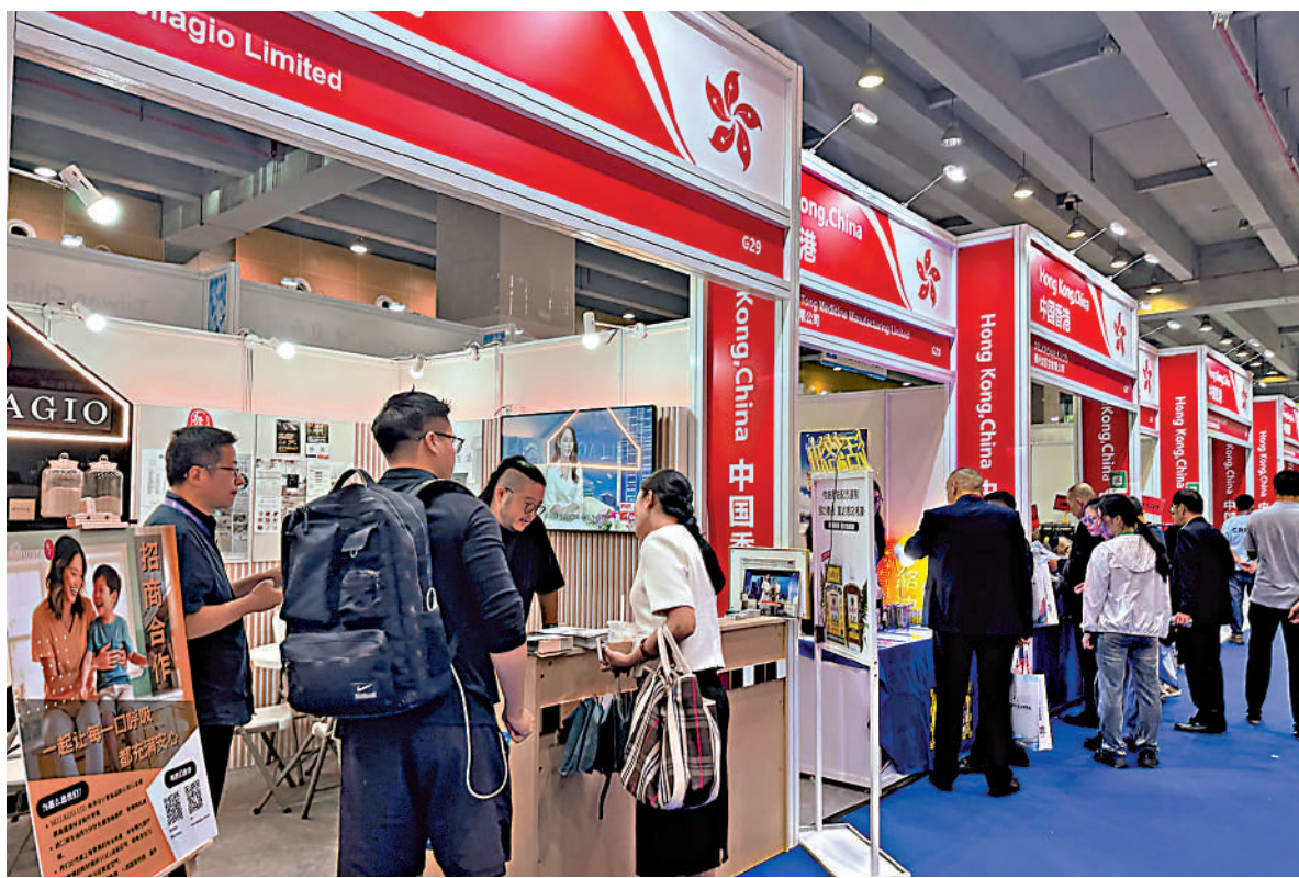
本屆中博會香港展區吸引不少人前來詢問了解情況。