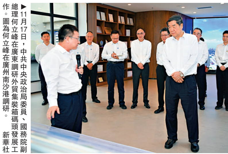
11月17日，中共中央政治局委員、國務院副總理何立峰在廣州南沙港調研。圖為何立峰在廣州南沙港調研。