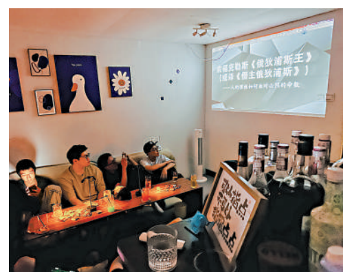
▲在廣州的學術酒吧活動中，分享者和聽眾在輕鬆愉快的氛圍中交流。受訪者供圖

▲在「生成式AI和他創造的世界」學術酒吧主題分享會現場，分享者精心準備了PPT，聽眾十分認真投入。受訪者供圖