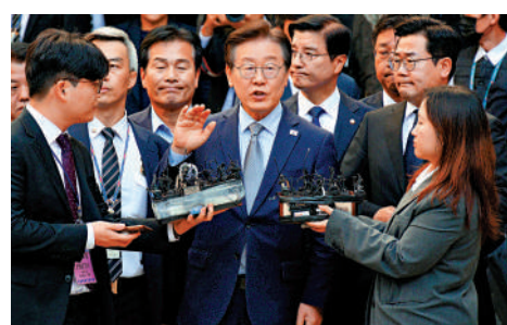
▲韓國最大在野黨共同民主黨黨首李在明（中）。