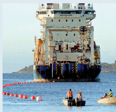
▲芬蘭工作人員正在將C-Lion電纜鋪設到波羅的海海底。資料圖片

美國官員此前警告稱，俄羅斯可能對關鍵基礎設施進行潛在的破壞行動，但俄方已多次否認相關指控。連接俄羅斯與德國的「北溪」天然氣管道2022年9月遭炸毀，丹麥、瑞典和德國分別啟動調查，但拒絕俄羅斯參與。今年9月，德媒稱破壞「北溪」的行動獲得時任烏克蘭武裝部隊總司令扎盧日內授權，由烏情報部門官員帶領多名平民實施。