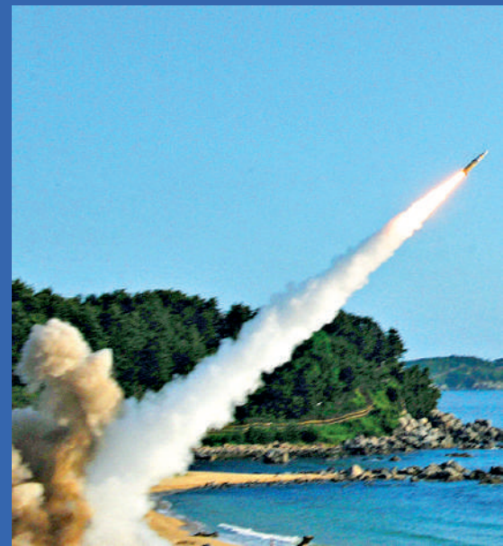
▼烏軍19日向俄境內發射ATACMS導彈，圖為美韓軍隊在軍演時發射ATACMS。資料圖片