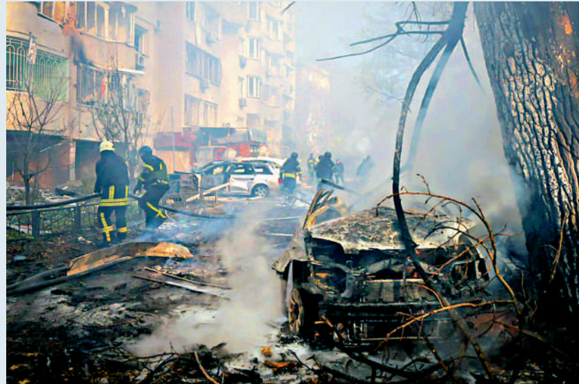
▲烏克蘭救援人員在敖德薩的導彈襲擊現場工作。