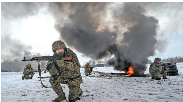
▲烏軍士兵在切爾尼戈夫州進行軍事演練。