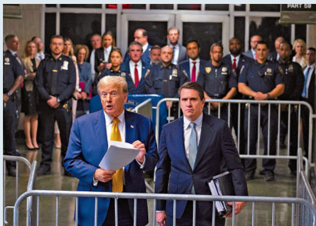
▶今年5月，特朗普（左）和律師布蘭奇在曼哈頓法庭外見記者。

除「封口費」案外，特朗普還面臨兩起聯邦刑事案件和干預佐治亞州2020年大選案。由於不能起訴在任總統，負責兩宗聯邦案件的司法部特別檢察官史密斯計劃在特朗普明年1月20日就職之前辭職。而佐治亞州的案件也已擱置多時，最後不了了之的概率很大。法律專家認為，特朗普基本上「已在所有四宗刑事案件中獲勝」。