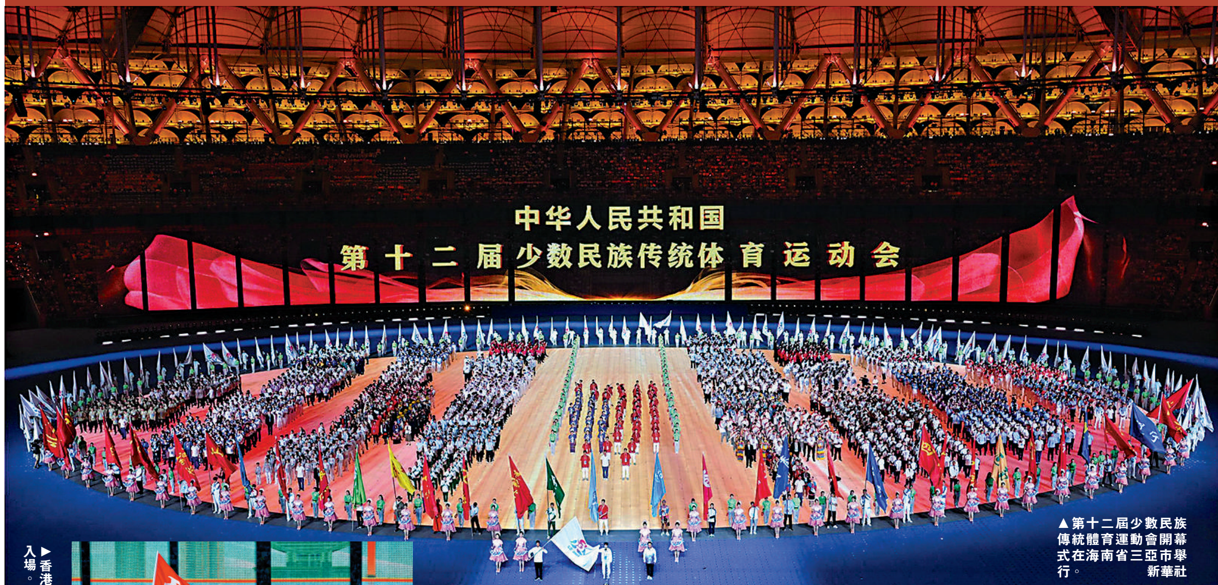
▲第十二屆少數民族傳統體育運動會開幕式在海南省三亞市舉行。