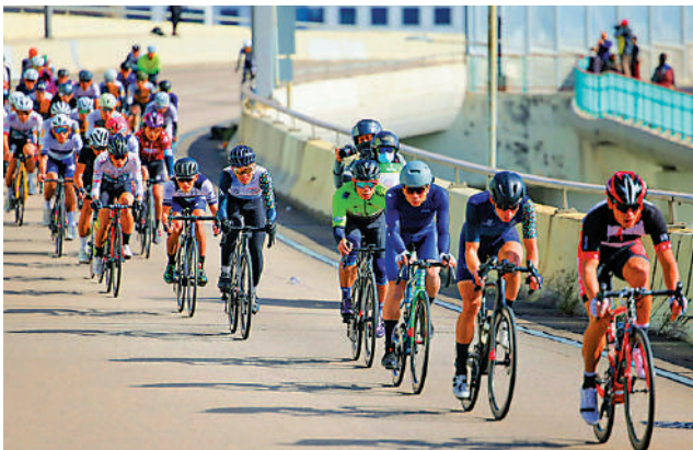
▲全運會公路單車測試賽比賽路線，將跨越珠海、香港、澳門三地，全程230公里。

全運會統籌辦公室主任楊德強早前表示，參賽選手將預先呈交證件進行登記及邊檢，而比賽日會在珠海起點進行安檢，全程閉環式管理，選手跨境參賽時毋須停賽進行過關手續，而賽會有系統監測選手的定位。比賽期間將會採取滾動式實時封路措施，以盡量減少對市民的影響。楊德強指出，屆時在參賽單車隊伍快到達相關路段時，賽會才會把該段道路臨時封閉，待單車經過後就會適時解封讓交通復常。