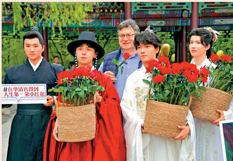
▲隨着中國免簽朋友圈增多，今年冬天，China Travel又要「燃」起來。圖為外國遊客在西安穿着漢服遊覽華清宮。