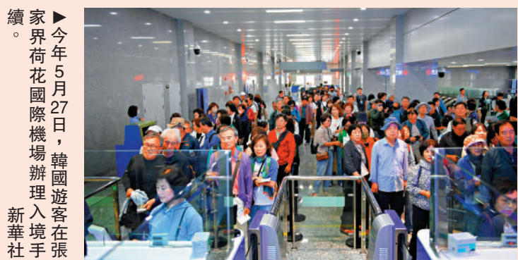
▲今年5月27日，韓國遊客在張家界荷花國際機場辦理入境手續。

【大公報訊】據中新網報道：對於近期越來越多外國人選擇來華旅遊，雲南財經大學首席教授明慶忠、聯合國世界旅遊組織專家楊森認為，一方面，中國的文化、美景、美食等對外國遊客有很大吸引力。中國旅遊研究院入境遊客滿意度專項