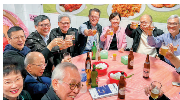
▲英偉達行政總裁黃仁勳前晚與財政司司長陳茂波、科大校董會主席沈向洋、校長葉玉如等聚餐，席上交流對創科發展和人才培育的看法。

孫東表示，曾向上海朋友談及北部都會區及河套的作用。他指出，北都就如上海當年的浦東，河套就如浦東的東方明珠，對方就明白對香港未來發展很重要。