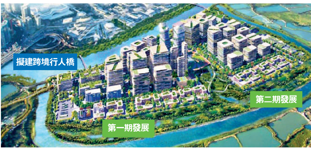
▲創科局局長孫東表示，目標是將河套香港園區打造為世界級產學研平台，並期望園區第一期的實驗室，可成為顛覆性技術發源地。

孫東表示，河套區連同深圳部分不足4平方公里，香港園區未必適合大規模生產，但可結合兩地優勢，成為世界級產學研和中試轉化基地，而兩地政府亦在積極商討如何便利兩地人員、物資、資金和數據等流通。