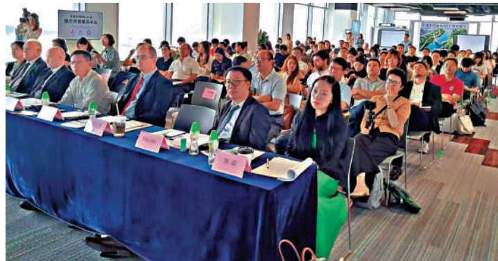
▲前海近期舉辦墨西哥推介活動，吸引大批商家出席。