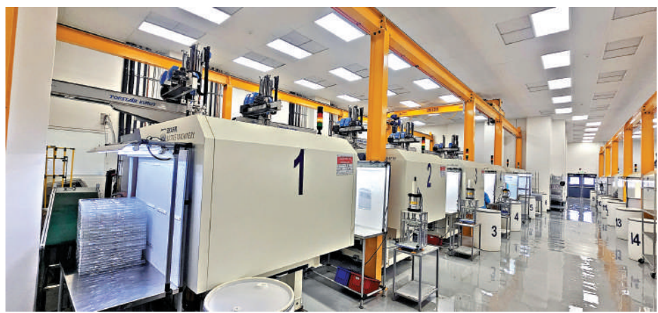
▲嘉瑞控股墨西哥工廠自動化程度高。 大公報深圳傳真