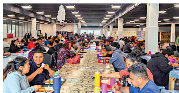
▲敏華控股墨西哥工廠員工聚餐。 大公報深圳傳真

構廠房，其中一棟共計兩層，總面積高達1.4萬平方米，其中兩根大樑間距達到10.75米，可以自由搬運和安放大型生產機器，適合大型工廠前來租用。工業區還配備千人規模的中餐和墨西哥餐食，可以滿足員工就餐需求。除了製造業外，廠房也會出租給服務製造業的物流和倉儲企業，方便貨物進出口。