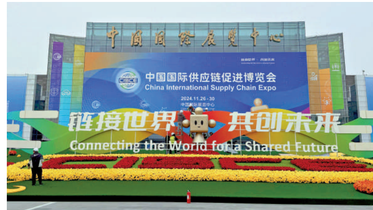
▲第二屆中國國際供應鏈促進博覽會，於11月26日至30日在北京中國國際展覽中心舉行。