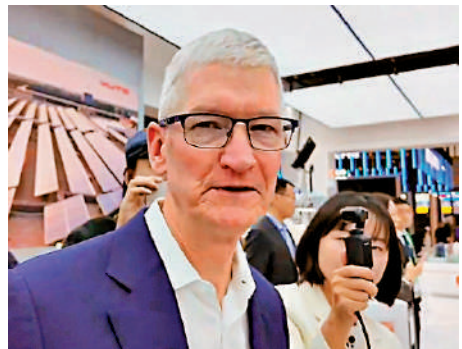
▲美國蘋果公司行政總裁庫克首次現身鏈博會，並表達對中國合作夥伴的高度重視。

第二屆中國國際供應鏈促進博覽會（簡稱「鏈博會」），於11月26日至30日在北京中國國際展覽中心（順義館）舉行。本屆鏈博會突出「鏈式」思維，全流程展示各鏈條上中下游重點環節，推動大中小企業聚鏈成群、優勢互補。25日，美國蘋果公司行政總裁庫克首次現身鏈博會，這是他今年內第三次訪華。他表示，蘋果非常重視在中國的合作夥伴，沒有他們，蘋果無法取得今天的成就。鏈博會蘋果公司展覽牌上介紹，蘋果200家主要供應商中80%在中國生產。