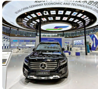
▲圖為本屆鏈博會中外經濟合作先行示範區展示點。