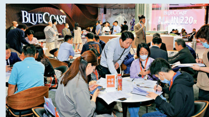
◀位於黃竹坑的Blue Coast是今年港島其中一個主要熱賣新盤。

隨着港島區大型新盤陸續落成，相信於來年初亦有大量港島新盤展開推售，當中包括太古柴灣海德園、嘉里為首發展黃竹坑站4期B海盈山新一期，以及新世界為首的黃竹坑站第5期，以至新世界北角皇都戲院重建項目，來年相信會有更多大型新盤登場，所以來年港島區的新盤銷售或許較今年更暢旺。 (作者為世紀21 Q動力總經理)