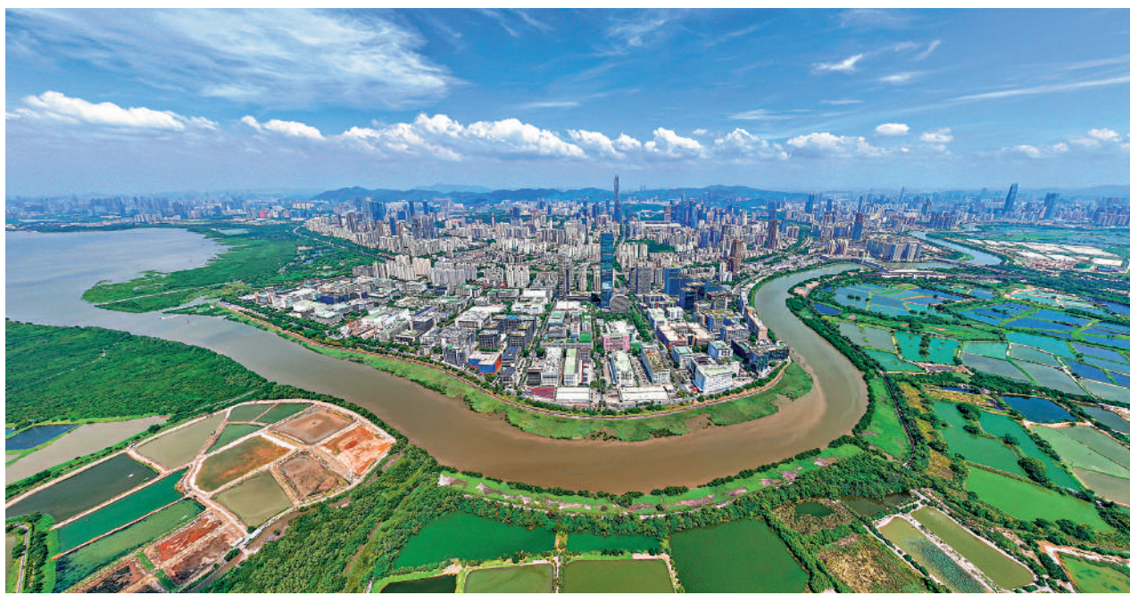
▲香港正積極向科技創新樞紐轉型，河套深港科技創新合作區將是有關轉型的核心引擎。