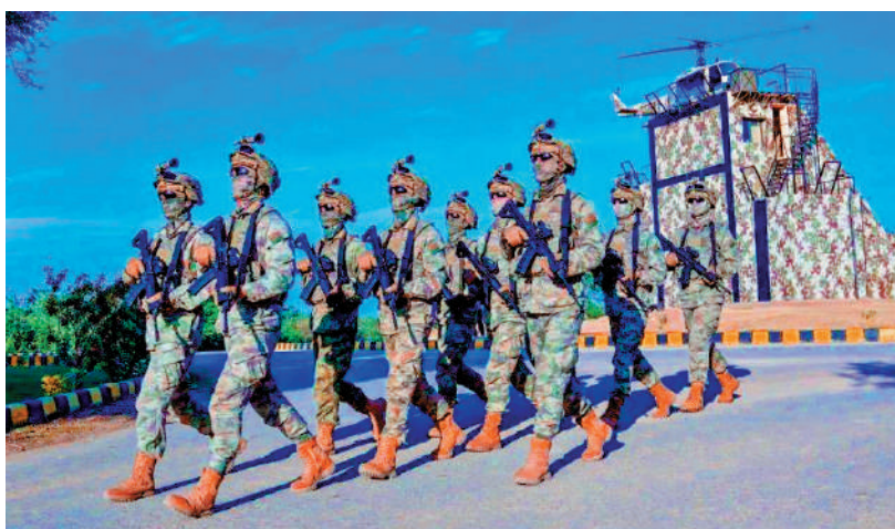
▲當地時間20日，中巴「勇士-8」反恐聯合演習開訓儀式在巴基斯坦帕比國家反恐訓練中心舉行。

組派兵力構成，包括中方聯合指揮部，特戰、陸航等作戰要素，以及其他聯合保障力量，共300餘人。記者注意到，除了全副武裝、荷槍實彈的參演官兵，還有裝甲車等大量新型裝備隨機運送。中方強調，演習不針對任何第三方，與地區局勢無關。